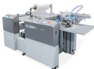
AMIGA 52 DOUBLE