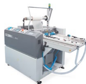
AMIGA 52 B / IN-LINE